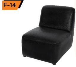
F-14 Lounge Chair (Sofa) 60X80X40 / 70 cm.