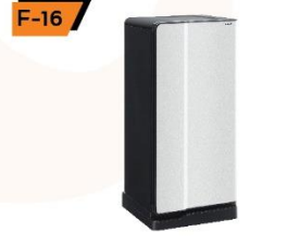
F-16 Refrigerator 4.4 cu.ft. 55X55X110 cm.