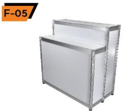
F-05 2 - Tier Counter 50X100X100 / 120 cm.