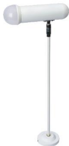
Spotlight 9W. with arm (LED)