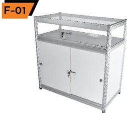
F-01 Counter Showcase 50X100X100 cm.