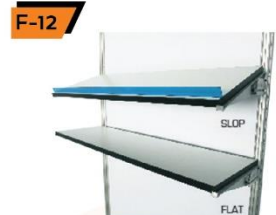
F-12 Wall Shelf 25X100 cm.