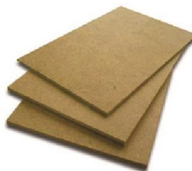
WOOD PLATFORM WITHOUT CARPET