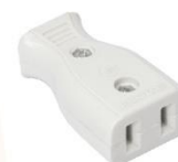
Socket for connecting by exhibitors per unit of 100W.