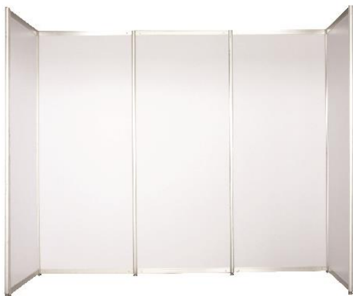
PANEL 100x250 CM (SYSTEM BUILT)