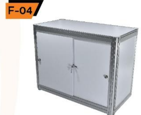
F-04 Lockable Cabinet 50X100X75 cm.