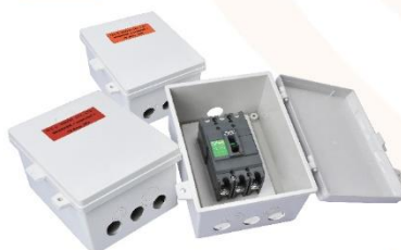
Circuit Breaker Three Phase 380V. 50Hz.