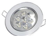
Down Light 7W. (LED)