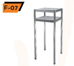
F-07 TV Shelf 50X50X120 cm.