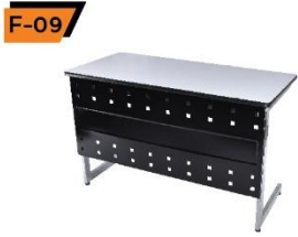
F-09 Receptionist Desk 60X120X75 cm.