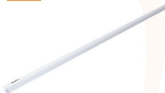
Fluorescent Light 1.2 m. 14W. (LED)