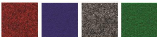
NEEDLE PUNCH CARPET RED/BLEU/GREY/GREEN