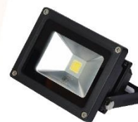
Floodlight LED 30W. 220V. Warm Light (LED)