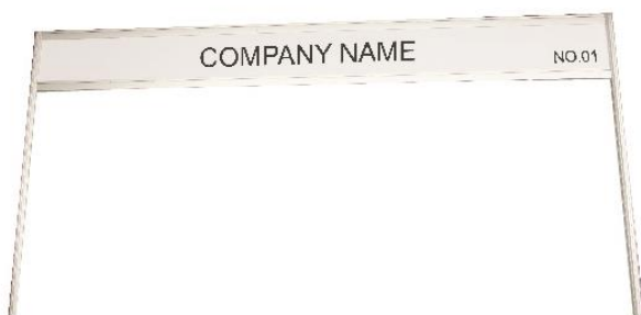
FASCIA BOARD WITH STANDARD LETTERING 10CM. HIGH 100x30 CM