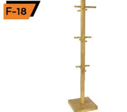
F-18 Cloth Rack 40X40X180 cm.