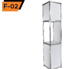
F-02 Tall Showcase 50X50X250 cm.