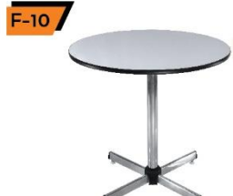
F-10 Round Table 75X75X75 cm.