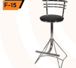
F-15 Black Stool 50X50X85 / 120 cm.