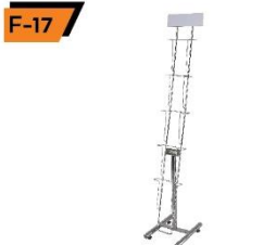
F-17 Brochure Stand 30X40X170 cm.