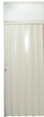
FOLDING DOOR 100x200 CM (SYSTEM BUILT)