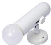
Spotlight 9W. standard (LED)