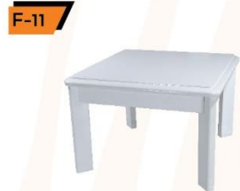
F-11 Coffee Table 65X65X40 cm.