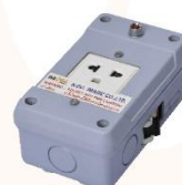
Socket 5 Amp (5 Amp fuse) 220V. 50Hz. (Not For lighting)