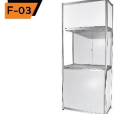
F-03 Big Showcase 50X100X250 cm.