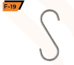
F-19 S-Hook 6.5 cm.

N.C.C. IMAGE CO., LTD. Queen Sirikit National Convention Center 60 New Rachadapisek Road, Klongtoey, Bangkok 10110 Thailand Tel : +66 2203 4152 Fax : +66 2203 4117