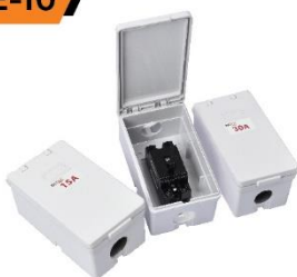
Circuit Breaker Single Phase 220V. 50Hz.