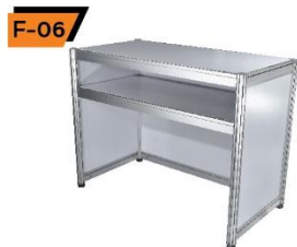
F-06 Counter 50X100X75 / 100 cm.