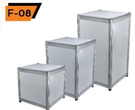
F-08 Display Stand 50X50X50 / 75 / 100 cm.