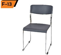
F-13 Fiber Chair 50X50X50 / 80 cm.