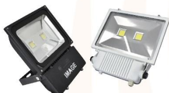
Floodlight 100W. 220V. Day Light (LED)