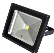
Floodlight LED 50W. 220V. Warm Light (LED)